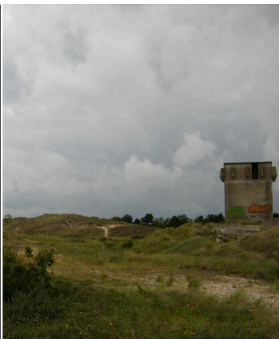
Stelling Den Helder Bunkers die u onderweg tegenkomt